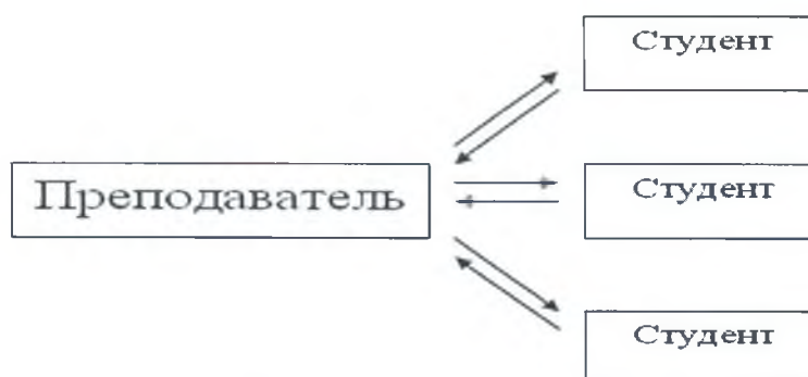
Рисунок 2. Активная модель обучения

2. Активная модель обучения - это форма взаимодействия студентов и преподавателя, при которой они взаимодействуют друг с другом в ходе занятия и студенты здесь не пассивные слушатели, а активные участники, студенты и преподаватель находятся на равных правах. Если пассивные методы предполагали авторитарный стиль взаимодействия, то активные больше предполагают демократический стиль (Рис. 2).